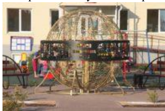
Памятник, посвящённый шахтёрскому труду в Кемеровском районе

Я, одна из представительниц молодежи, современный подросток, живу в Кузбассе, а Кузбасс богат каменным улем. Одной из ведущих отраслей является добыча угля, шахты, разрезы. Наш уголь пользуется спросом во всём мире. Я никогда раньше об этом не задумывалась. А если задуматься, то, оказывается, очень многие из моих родственников работают в угольной промышленности. Шахтёров считают героями, так как их труд опасен и тяжёл, но ведь ещё – это обычные люди, у которых, помимо работы, есть какие-то увлечения, семья и друзья. И на всё у них хватает времени, это ещё раз подтверждает величие образа шахтёра, именно поэтому труду шахтёров посвящают памятники, монументы и стеллы. Памятник, установленный в Кемеровском районе, представляет собой металлический шар, являющийся символом силы духа и единения шахтёрского братства. Его опоясывает конвейерная лента — ещё один символ подземного труда. В центре шара горят три светильника, напоминающие о горящих сердцах горняков.